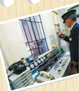
케이블카 엔라쿠지역에 있는 운전실에서 관상기를 조작하고 있는 모습