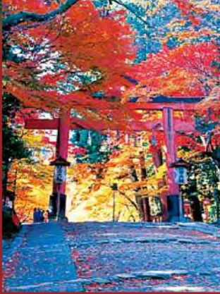
봄엔마치 사카모토의 돌담길