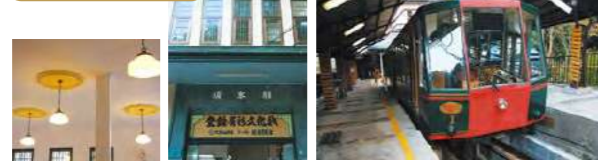
'케이블 사카모토역' 1925년에 건설된 목조 2층의 양식건물. 당시의 현대적인 양식건축으로 인기를 모았다고 합니다. 국가등록 유형문화재로 등록되었습니다.