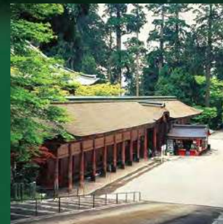
엔라쿠지 절 곤폰추도 (동탑) 세계문화유산으로 등록되어 있는 '엔라쿠지 절'은 덴로대사 사이초가 개산한 천태종의 총본산. 히에이산중에 있는 세개의 탑(동탑, 서탑, 요카와) 지역으로 나뉘며, 이를 총칭하여 히에이산 엔라쿠지 절이라고 합니다.