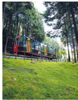
환상적인 가로수 터널을 지나면 드디어 히에이산의 모습이 나타납니다.